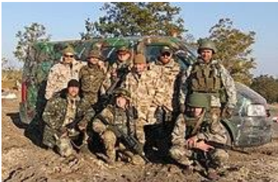
Unidad de combate, en la que se integran miembros y fundadores de Aerorozvidka en el año de 2015.

En julio de 2020, el GRUPO AEROROZVIDKA (Grupo de Aerorreconocimiento) fue registrado como una Organización No Gubernamental (ONG) de voluntarios y la unidad militar A2724 fue disuelta. Sin embargo, en marzo del año siguiente la