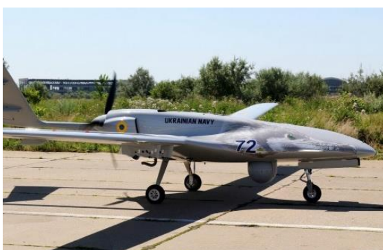
UAS Bayraktar TB2 operado por la Marina de Ucrania. Image: Ministry of Defense of Ukraine. License.

La vida operativa de los UAS no suele superar uno o dos días antes de ser derribados, pero su relativo bajo precio y la variedad de tareas en los que son empleados, le convierten en una herramienta versátil y altamente eficiente para la