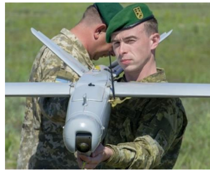
UAS PD-1 y Leleka-100 operados por las FAS de Ucrania.

Desde febrero de 2020 el UAS o Dron se ha convertido en un arma habitual y de uso generalizado, más cercana del concepto de munición de bajo coste y alto rendimiento que de plataforma aérea, teniendo en cuenta su alto nivel de consumo.