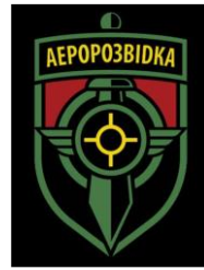
El primer logro de Aerorozvidka en 2014 y el actual desde 2020.

En 2015, este grupo de ingenieros informáticos y aficionados a los aeromodelos, que también habían tomado parte en el Maidan y colaborado con unidades de fronteras y militares de inteligencia, se unieron a las Fuerzas Armadas de Ucrania formando la unidad militar A2724 del Ministerio de Defensa. En principio, se denominó Centro para la Implementación y el Soporte de Sistemas de Control Operacional Automatizado, e integrándose en las Fuerzas de Comunicaciones y Seguridad Cibernética de las Fuerzas Armadas de Ucrania. Su citado fundador, Volodymyr Kochetkov-Sukach, murió en combate durante ese mismo año en el Donbas.