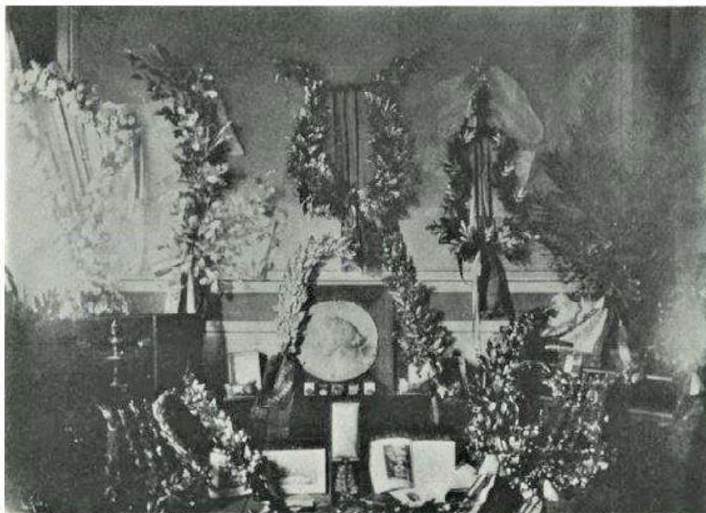
Exposición de los trofeos y obsequios.

El viernes partieron profundamente impresionados por todas las atenciones recibidas en la gira por el sureste francés y que contribuyeron a realzar la enérgica corriente de simpatía hacia los asuntos españoles.