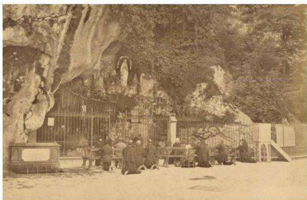
Lourdes: La Gruta en 1896

A las 5:00 del miércoles llegaron a la estación de Lourdes. Esta parada les sirvió para poder interpretar durante la misa diversas obras, lo que los llevó a poseer «el honor de ser la primera banda militar en la historia que actuaba en el interior de la gruta de la Virgen».