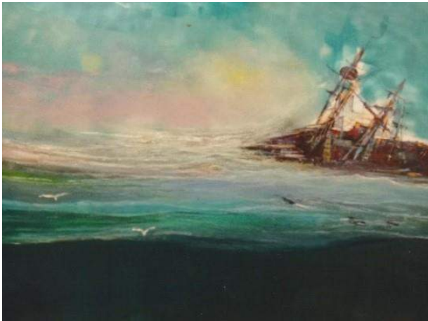
Carlos Barcón Collazo, Marina, óleo sobre lienzo.

Tratar la mar en el Arte, la mar en la Pintura, es lo mismo que decir la mar en la Historia, pues la Mar es uno de los grandes temas de la pintura universal. Y en España, que siempre fue una tierra de grandes pintores, la aportación de los pintores y de El Ferrol a esta especialidad de marinistas es bastante notable.